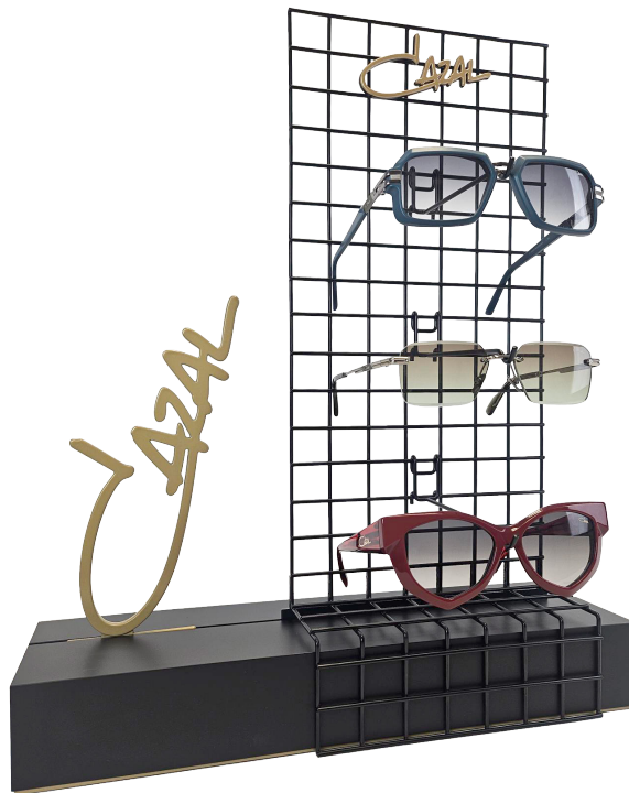
OPTION A – PRÉSENTOIR EN TROIS PARTIES