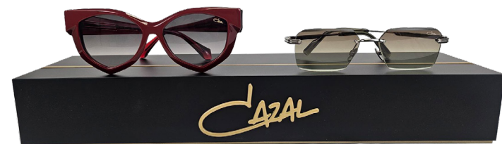
OPTION B – Der zweiteilige Präsentationsblock